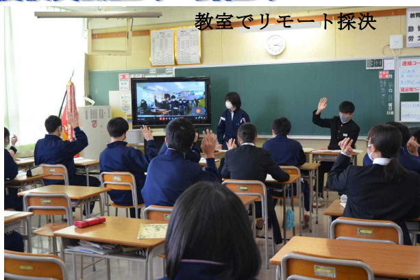
教室でリモート採決

1月27日(金)、秀峰会後期生徒総会、役員認証式・引継式が行われました。感染症対策として全校集合ではなく、各教室と執行部等役員をリモートでつなぐ総会となりました。これまでもリモートによる様々な集会を行ってきた生徒たちにとっては慣れたもので、スムーズな進行で滞りなく見事に運営することができました。