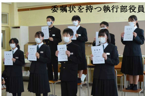
委嘱状を持つ執行部役員

今年度の秀峰会は「Challenge …」というスローガンが行事の随所でも出ていました。Challenge は挑戦という意味の他に「やりがい」という意味もあります。挑戦して様々な行事をやり遂げ、やりがいを感じながらさらに意欲を高め、次に挑戦していく。そんな精神を見事に表していたと思います。令和4年度秀峰会の皆さん、本当にお疲れ様でした。そして、ありがとうございました。