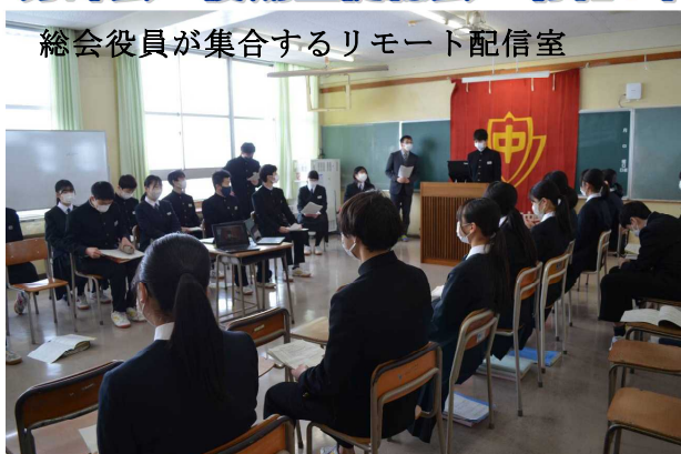
総会役員が集合するリモート配信室